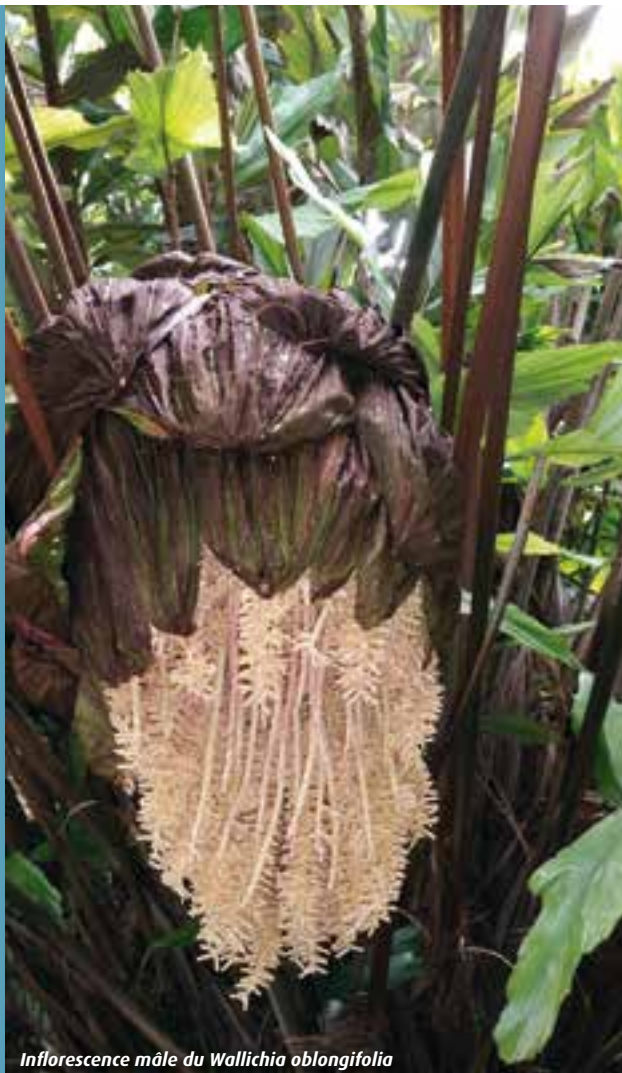
Inflorescence mâle du Wallichia oblongifolia

pu voir la forme himalayenne de Caryota maxima et le Caryota rumphiana la tête hors de la serre ! Y sont cultivés Acrocomia aculeata , Calamus sp , Dypsis decaryi , D. lutescens , Dictyosperma album , les Latania , quelques Licuala et Arenga dont A. caudata , un bel exemplaire de Wallichia oblongifolia qui fleurit, Acoelorrhapha wrightii , Rhopalostylis bauerii , Syagrus weddelliana . Plusieurs autres espèces y ont été installées ces dernières années.