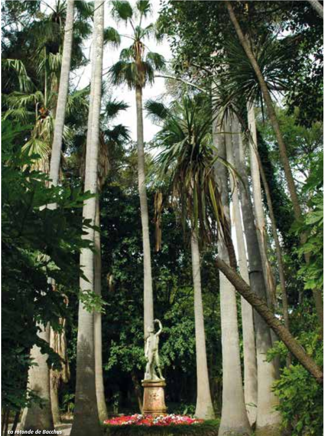
La rotonde de Bacchus