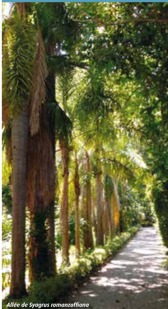
Allée de Syagrus romanzoffiana