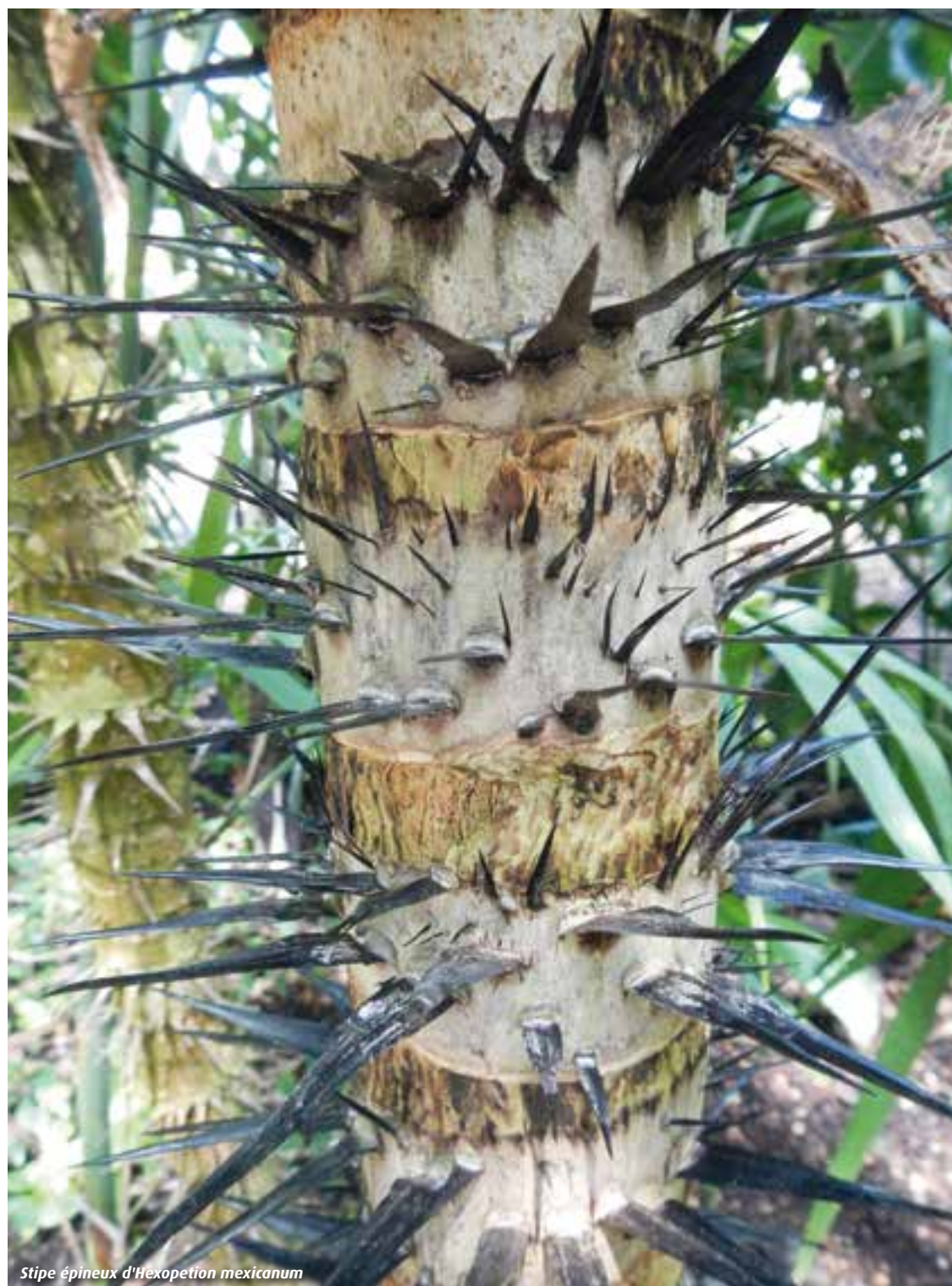
Stipe épineux d'Hexopetion mexicanum