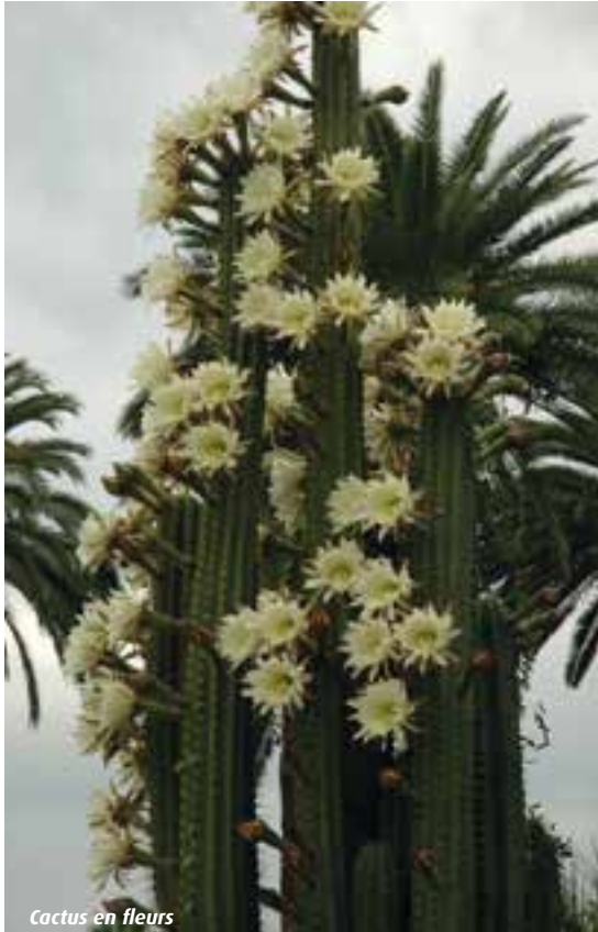
Cactus en fleurs