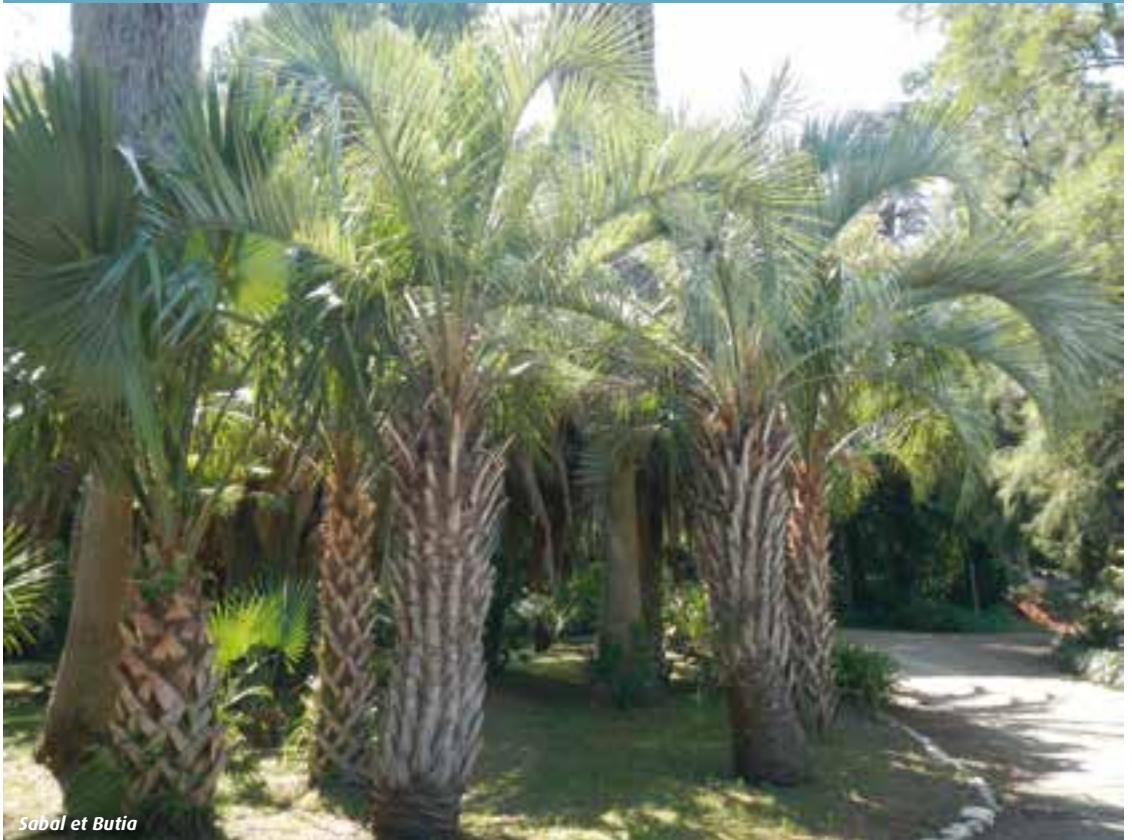
Sabal et Butia

à essayer de les identifier avec un succès mitigé car, comme cela a fréquemment été fait au XX e siècle, les graines étaient récoltées dans des jardins où plusieurs espèces poussaient en s'hybridant ! Dans la partie du jardin appelée « Le tropical », qui est la zone la plus étonnante par son exotisme, on trouve pêle-mêle