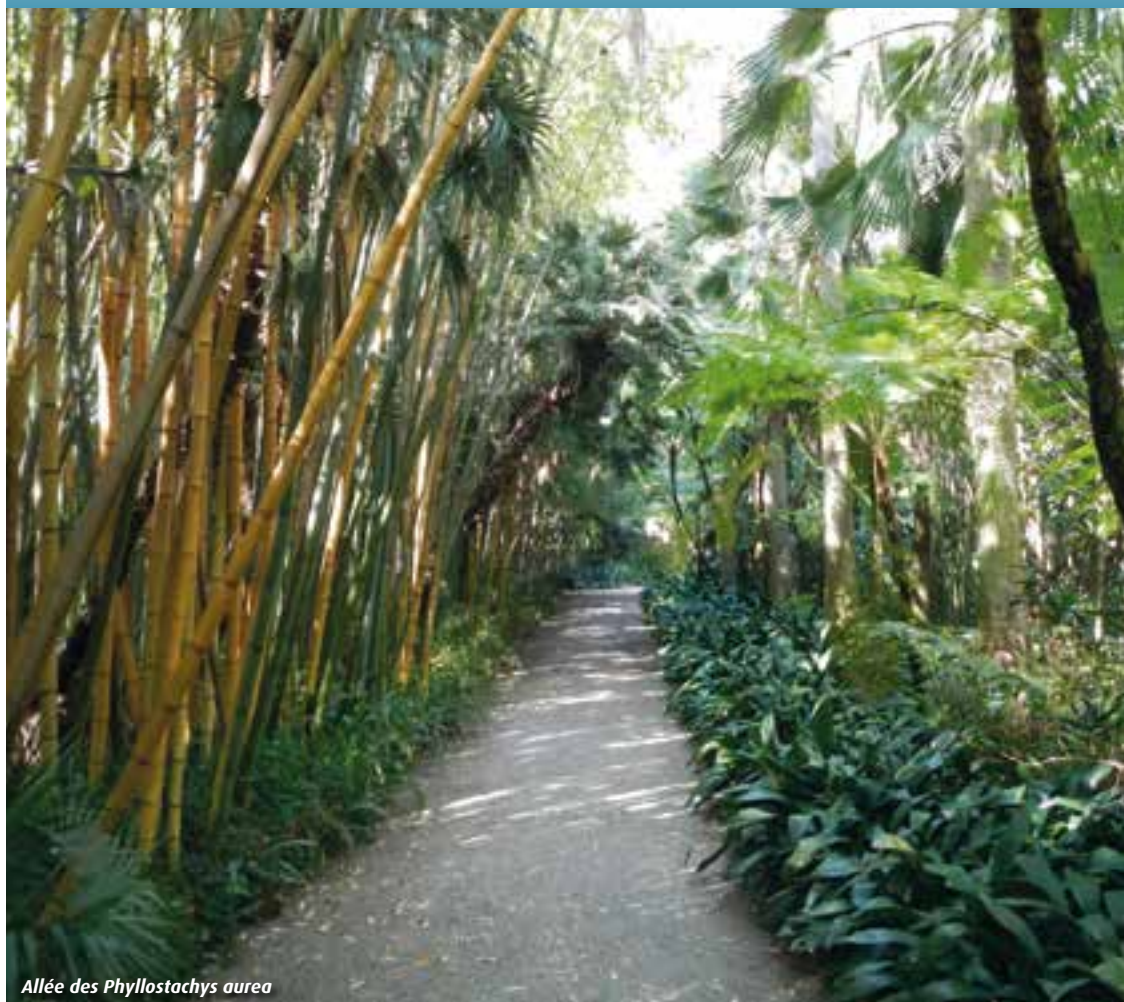
Allée des Phyllostachys aurea