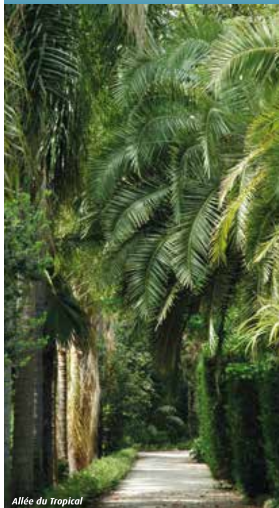
Allée du Tropical