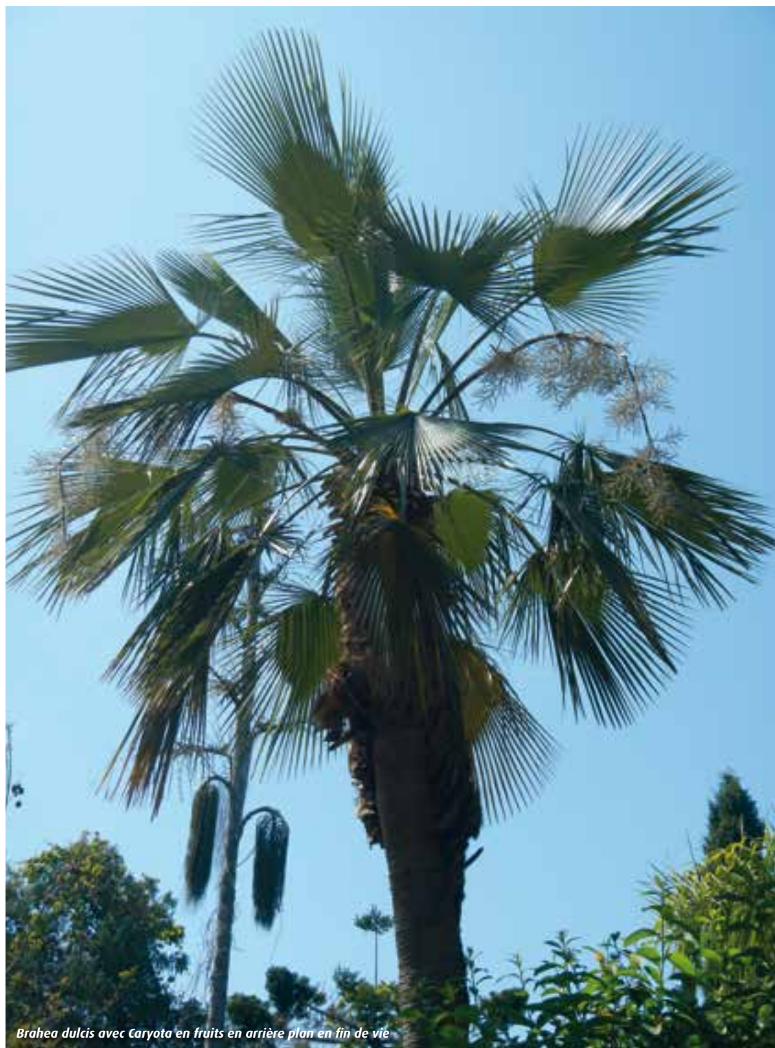
Brahea dulcis avec Caryota en fruits en arrière plan en fin de vie