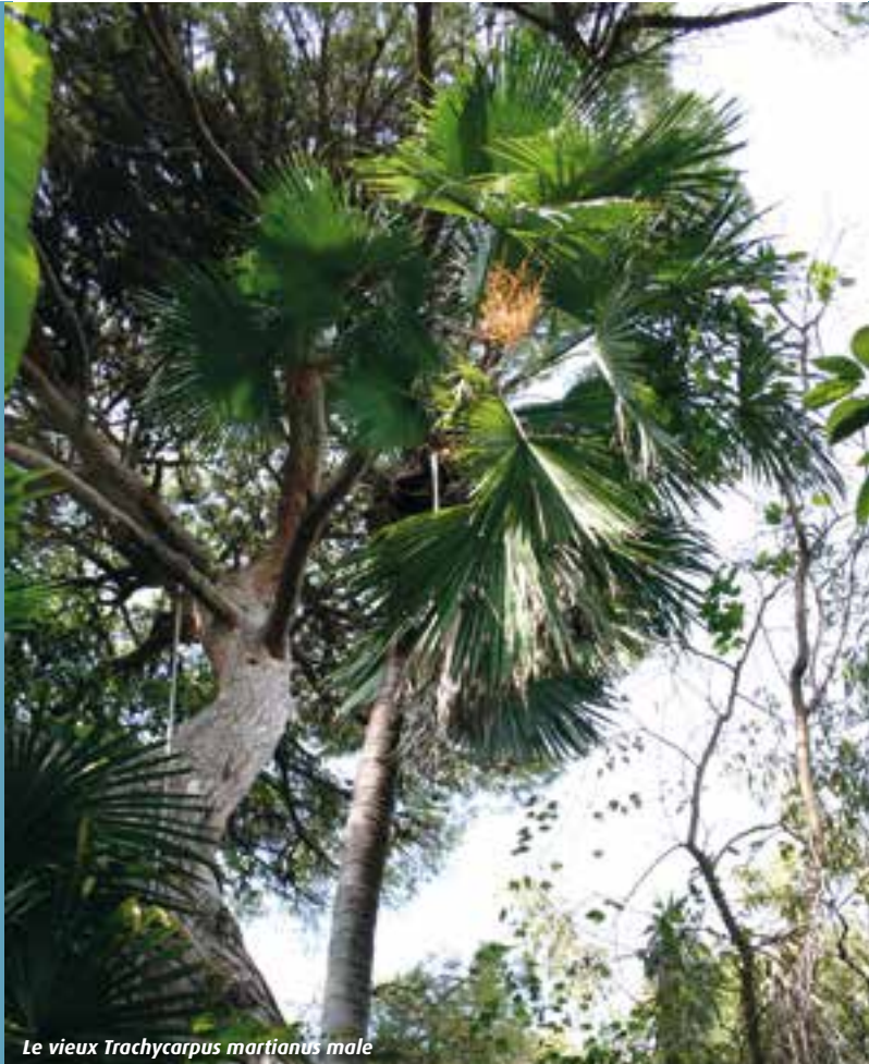
Le vieux Trachycarpus martianus mâle

de bambous le fameux Rhopalostylis sapida devant lequel plus d'un Fou s'est extasié car, malgré sa blessure, il a pu sortir indemne des épisodes hivernaux de 1985 et 1986. Encore un peu plus loin dans des dégagements apparaissent Trithrinax brasiliensis , Rhapidothylus hystrix , Serenoa repens , Phoenix rupicola et reclinata , des Chamaerops , mais