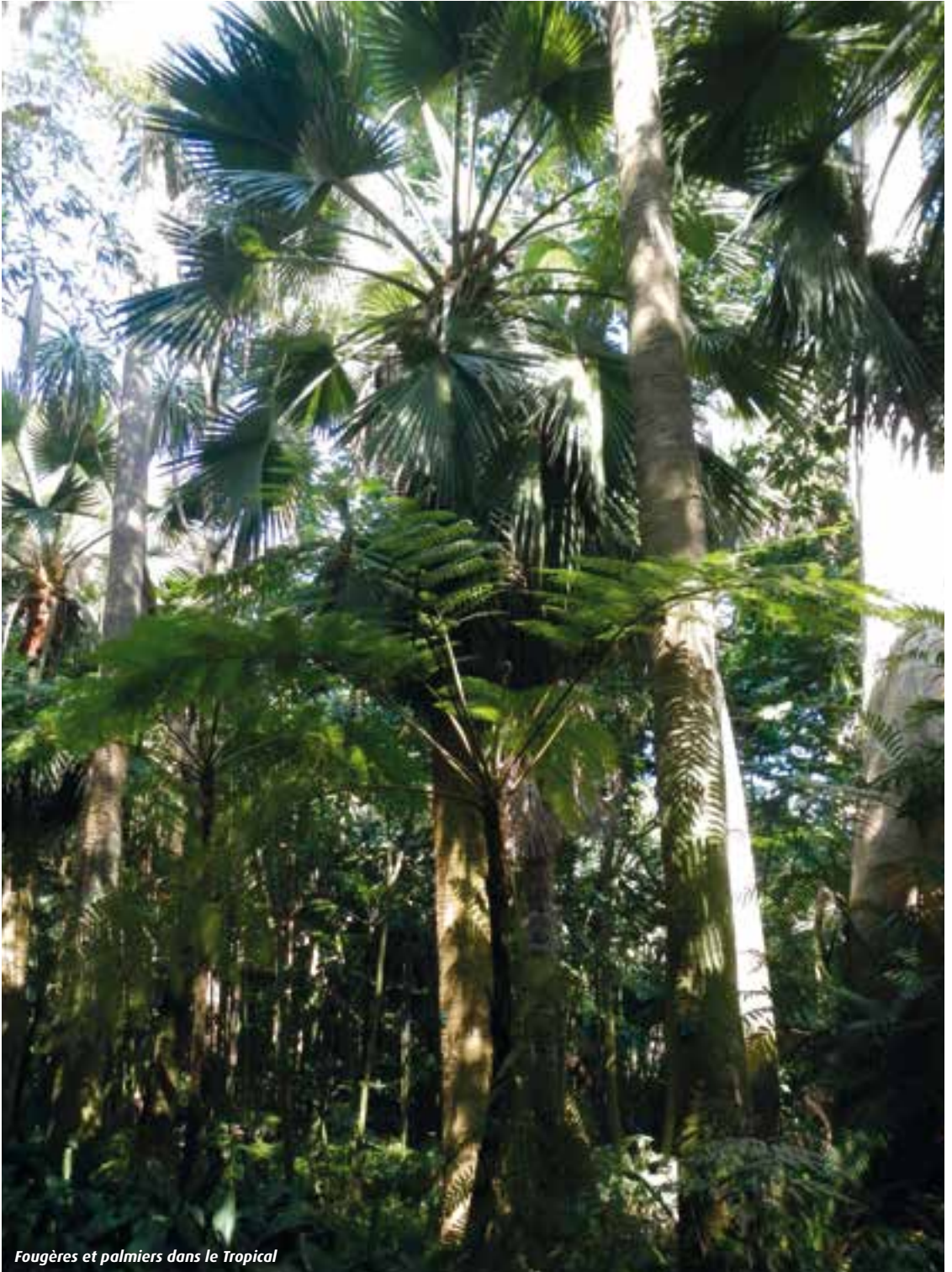
Fougères et palmiers dans le Tropical