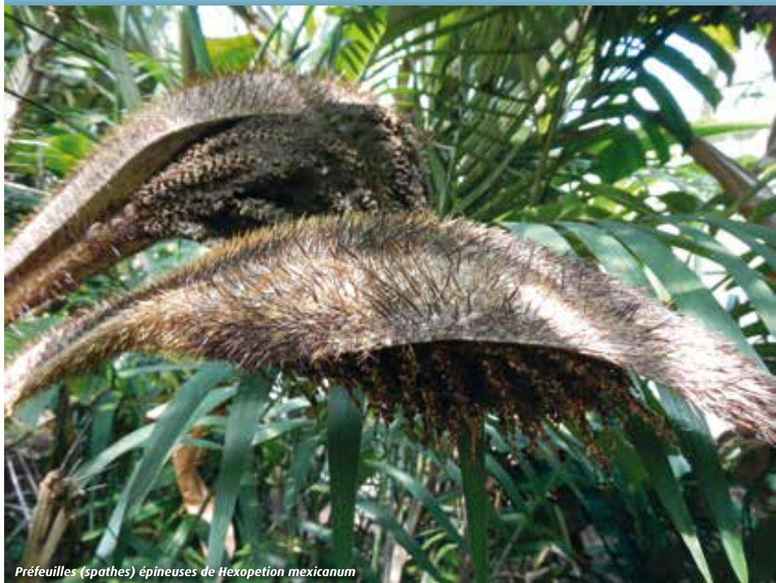
Préfeuilles (spathes) épineuses de Hexopetion mexicanum

Cette collection se compose de palmiers nécessitant une protection hivernale et d'autres qui sont rustiques en extérieur. Les plus fragiles au froid sont placés dans la Grande Serre Tropicale qui contient un nombre impressionnant d'espèces de plantes nécessitant une température de serre chaude ; on y trouve, entre autres, Chambeyronia macrocarpa et Hexopetion mexicanum (ex Astrocaryum ).